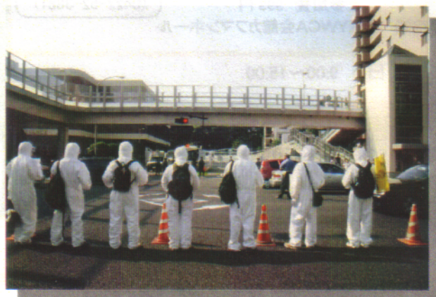
米ゲート前で原子力空母に抗議する市民