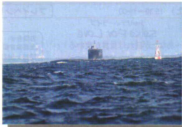
浦賀水道を航行する原子力潜水艦シャイアン