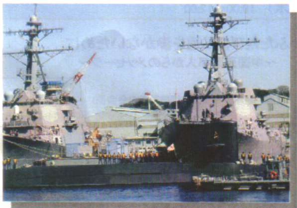
米イージス艦と海自潜水艦