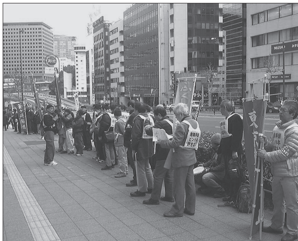
*昨年3月1日、除染労働者を先頭に、大手ゼネコン本社に対する抗議・申し入れ行動をおこなった。