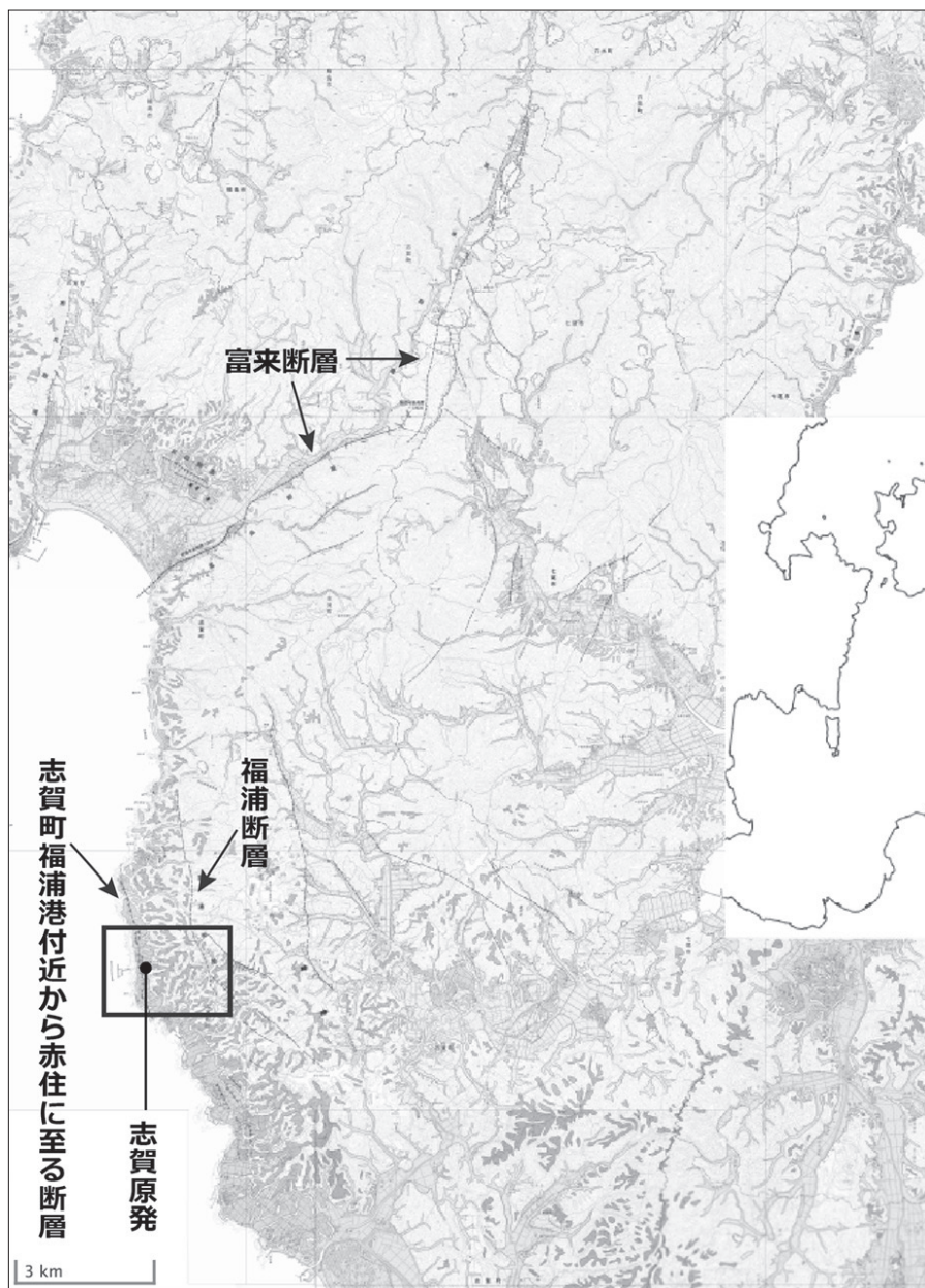
図1 志賀原発と「富来」活断層図（国土地理院活断層図「富来」に加筆）

川断層が一体のものとして認定され、富来断層と名前があらためられた。富来断層は、海に入ると南側に折れ曲がってすすんでいるとみられるのだが、海へと連続する部分がどれだけになるのかは未知であるため、評価上は14キロメートル以上となっている。